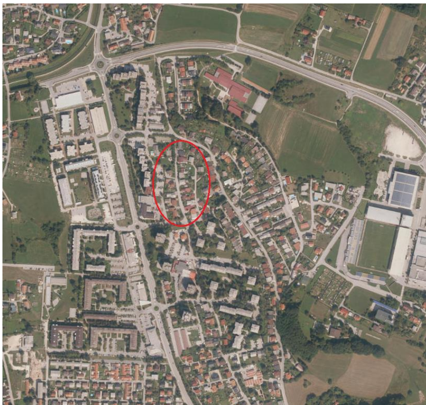
Slika 1: Območje obdelave – Ulice bratov Vošnjakov v Celju.

Predmet slednje projektne dokumentacije (PZI) je izdelava sekundarne kanalizacije na območju Ulice bratov Vošnjakov v Celju.